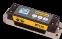
XT290 digitalt maskinpass