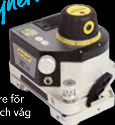
XT20 lasersändare för raket, planhet och våg